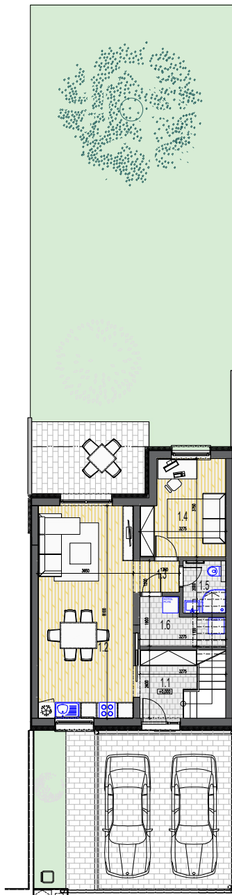
LEGENDA MIESTNOSTÍ NA 1.NP RRD TYP C